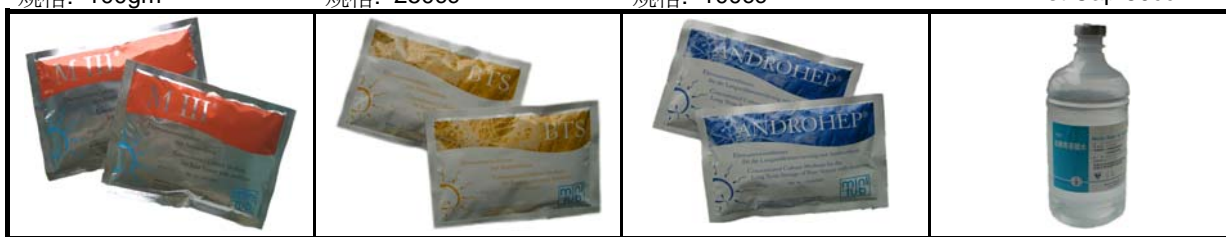
編號: 112.100 中文: 莫克精液稀釋粉60g 英文: Merck III Extenders 規格: 60g for 1000cc 編號: 112.300 中文: BTS精液稀釋粉50g 英文: BTS Extenders 規格: 50g for 1000cc 編號: 112.104 中文: 安卓特長效精液稀釋粉49.5g 英文: Androhep Extenders 編號: 112.010 中文: 稀釋用水 英文: Distilled Water 1000cc