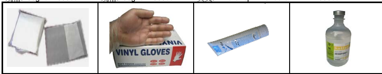
編號: 104.008C 中文: 濾精袋 英文: Semen Filter Bag 規格: 6L(100 PCs/Bag) 編號: 104.015 中文: 無粉採精手套 英文: Collection Vinyl Glove 規格: Box/100 PCs 編號: 106.016 中文: 適潤膏 英文: Tapio Co Lubricant 規格: 250cc(義大利) 編號: 118.010 中文: 生理食鹽水(沙林) 英文: Sodium Chloride 規格: 1000cc/ 9%