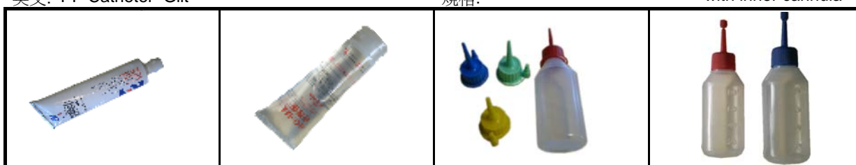
編號: 106.010 中文: K-Y潤滑膏 英文: K-Y Lubricant 規格: 100gm 編號: 106.017 中文: Lu-Ok適潤膏 英文: Lu-Ok Lubricant 規格: 250cc 編號: 105.052 中文: 斜口授精軟瓶 英文: Semen Bottle 規格: 100cc 編號: 105.050C 中文: 授精軟瓶(折蓋式) 英文: Semen Bottle with Twist Cap 80cc