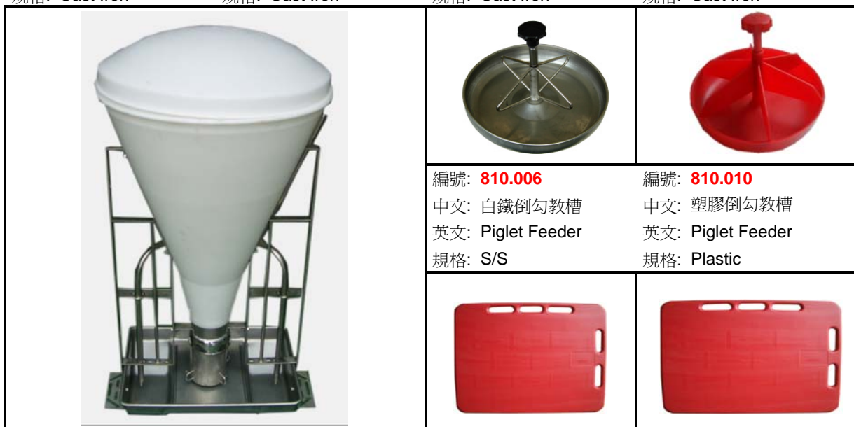
編號: 810.521 中文: 80kg不鏽鋼濕式飼料桶 英文: 80 Kg Wet Feeder 規格: 75x75x125cm