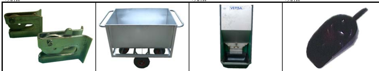
編號: 322.010 中文: 不鏽鋼 S/S 編號: 322.000 中文: 鍍鋅們扣 G.I