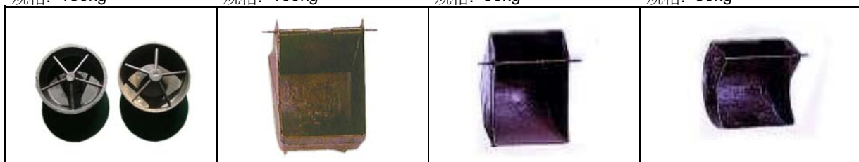
編號: 810.005 中文: 小教槽 英文: Creep Feeder 規格: Cast Iron